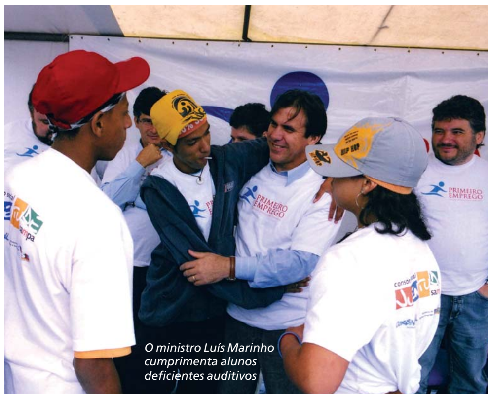
O ministro Luís Marinho cumprimenta alunos deficientes auditivos