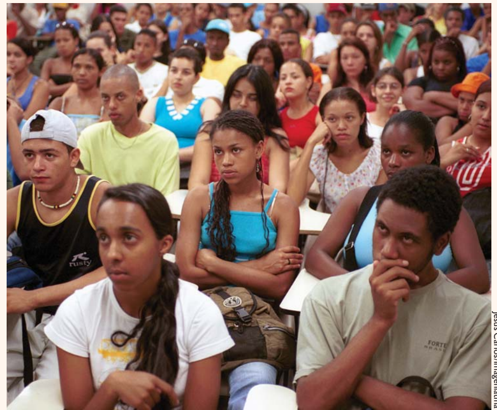
Alunos receberam conhecimento para lidar com situações cotidianas no mundo do trabalho

A intenção foi ensinar aos jovens noções sobre como escrever de maneira